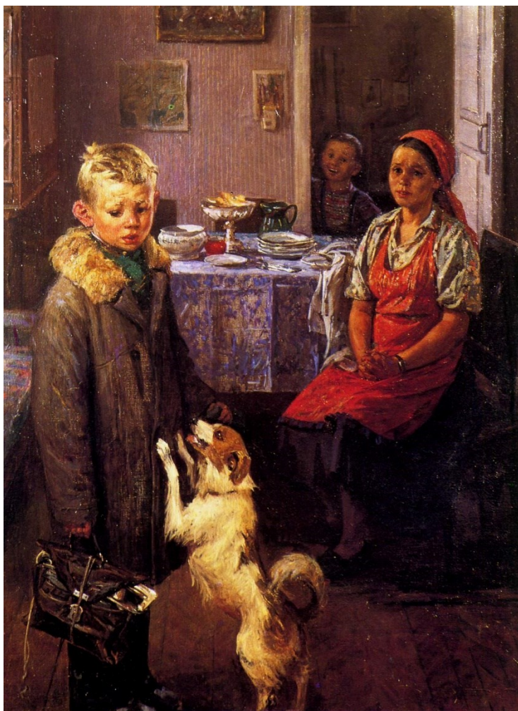
Ф.П. Решетников «Опять двойка!», 1951 г.

Задание 2. Проанализируйте изображение и выполните задания «3)» – «4)»